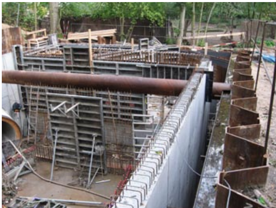
Bygværket ved Zoo

Efter en længere periode med opgravning i Lindevej fik vi inden sommerferien afsluttet arbejdet og reableret vejen fra Jernbanevej og til Lindevej 33. Herefter har vi lagt nye ledninger mod nord frem til den udgravning, hvor den sidste store tunnel sluttede. Nu hvor tunnelen er færdig, kan vi begynde arbejdet med at koble den store tunnelledning sammen med de nye ledninger i Lindevej. Vi håber at afslutte arbejdet i Lindevej og reablere vejen inden jul.