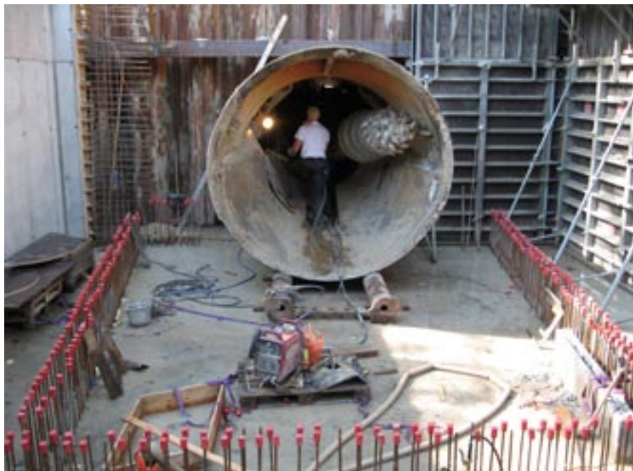
Boremaskinen ankommet til bygværket ved Zoo

Tunnelarbejderne har i de seneste måneder kørt på højtryk, og som nævnt er alle tunnelerne nu færdige. Vi har netop afsluttet den sidste tunnel, der går fra Nettos parkeringsplads til Lindevej. Den har en længde på 155 meter og en diameter på 1,6 meter. Derudover har vi hen over sommeren arbejdet på en tunnel fra Nettos parkeringsplads til Fruens Bøge syd for Odense Zoo. Tunnelen er 265 meter lang og har en diameter på 2,5 m.