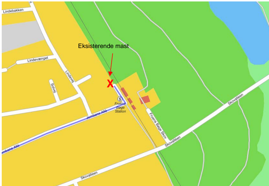
Eksisterende mast på Krak