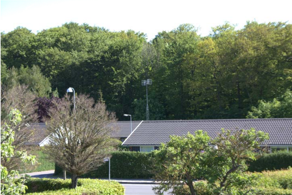
Eksisterende mast set fra Jernbane Allé 22