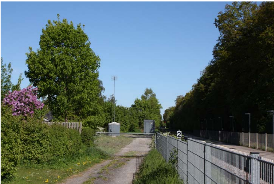
Eksisterende mast set fra enden af Jernbane Allé